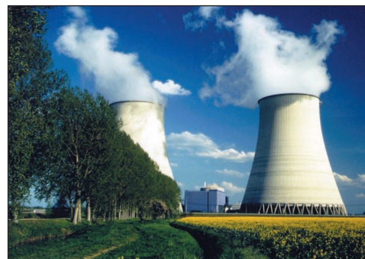
Centre Nucléaire de Production d'Électricité

Des conférences sur la diversité des moyens de production d'énergie utilisés par EDF peuvent être réalisées par EDF, dans les écoles ou dans les municipalités. Le site est fermé aux visites depuis les événements du 11 septembre 2001.