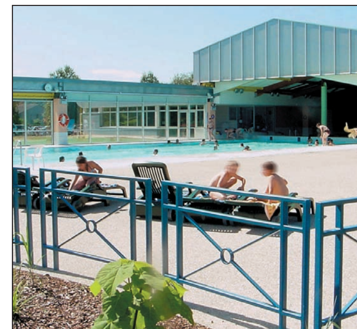
Piscine intercommunale des Presles (découvrable)