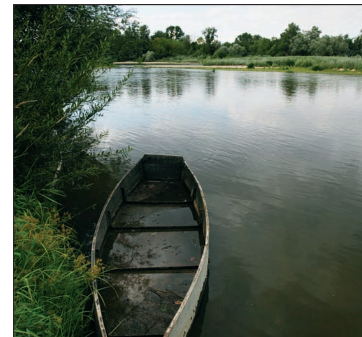
Les bords de Loire