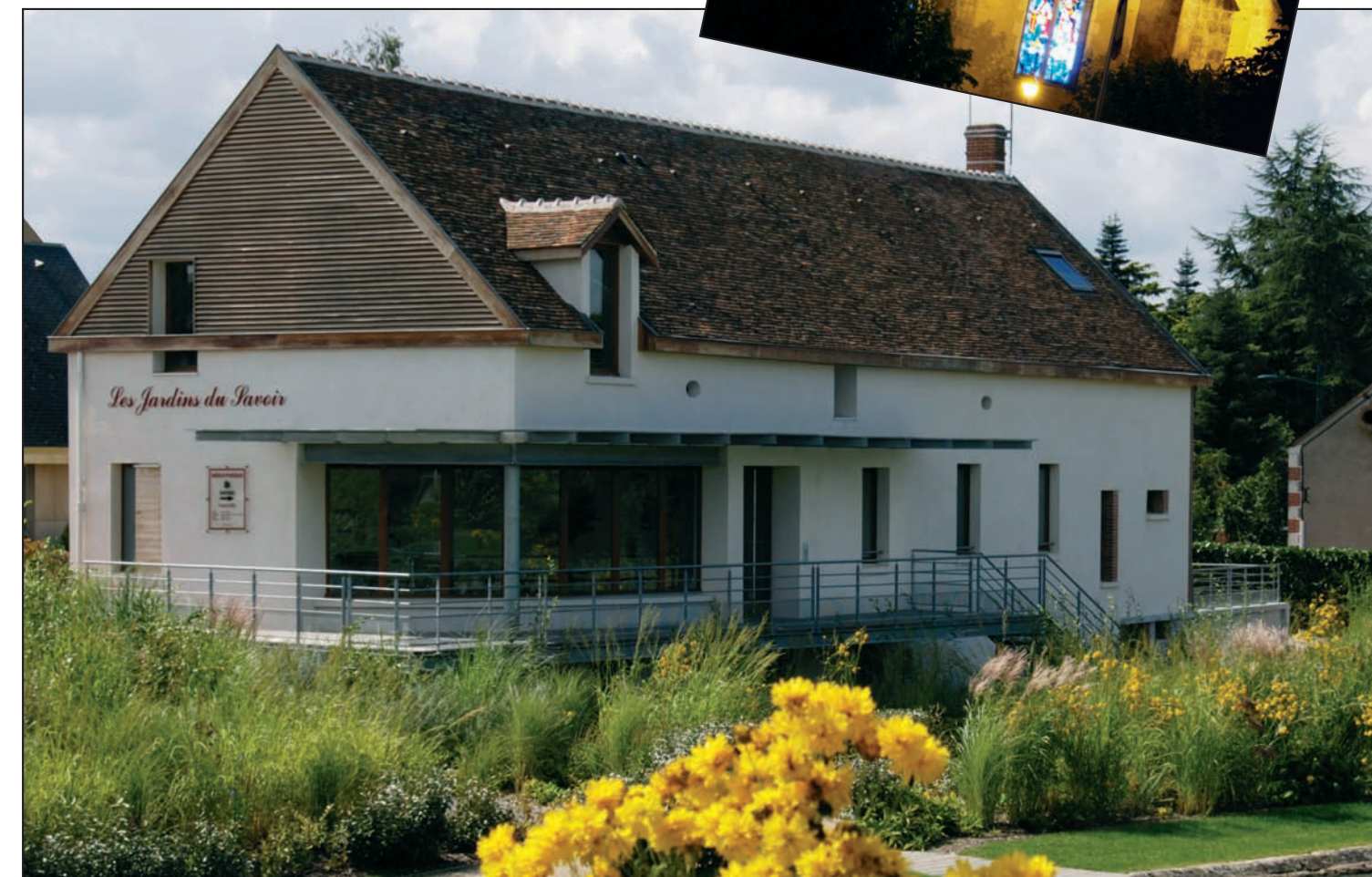
Les Jardins du Savoir - Médiathèque