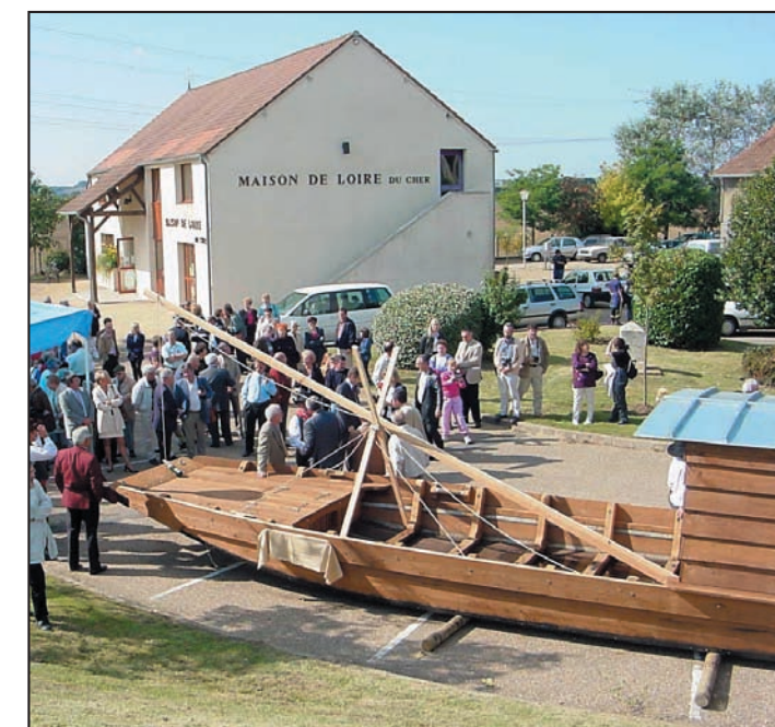
Animations en Maison de Loire