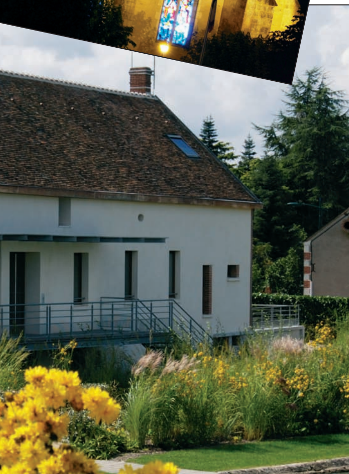
Les bords de Loire