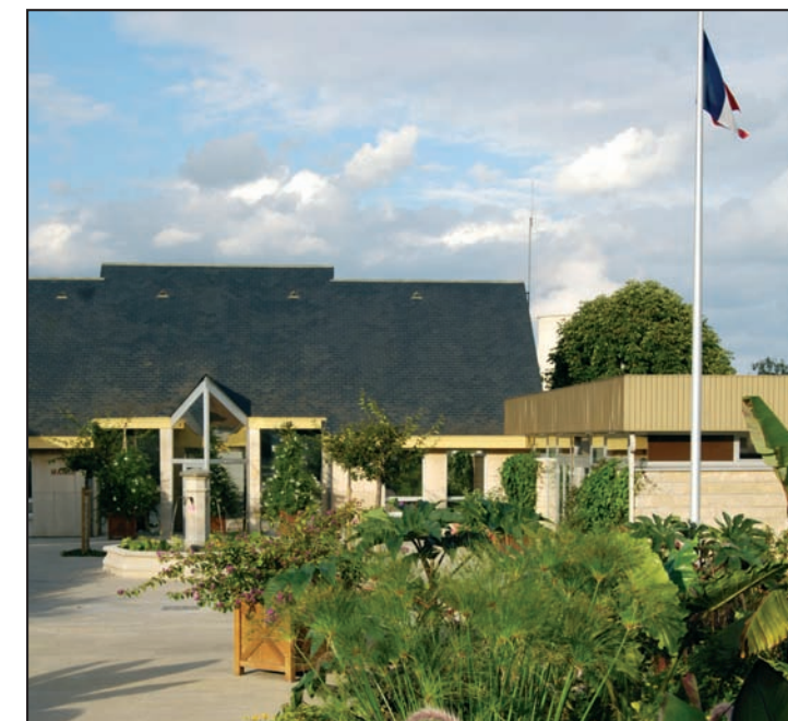
Mairie (Belleville village fleuri ***)