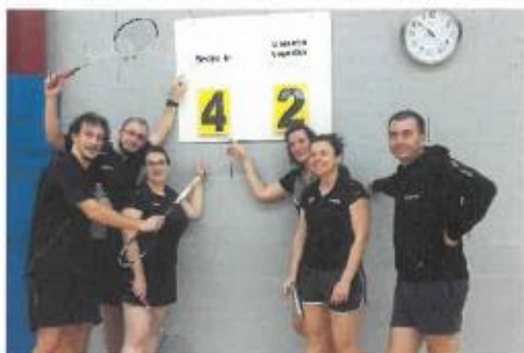
EQUIPE RESERVE D2