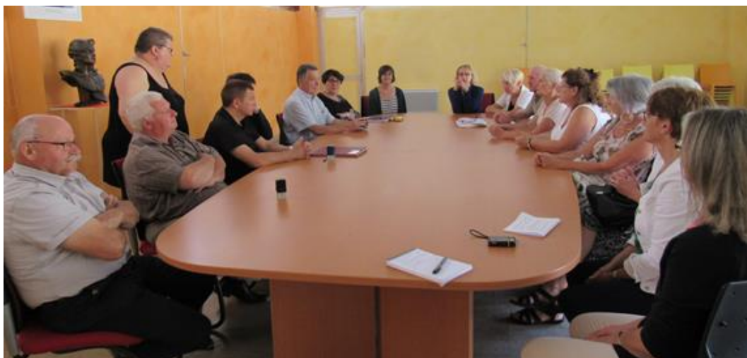
A droite de la photo : agents et bénévoles des médiathèques