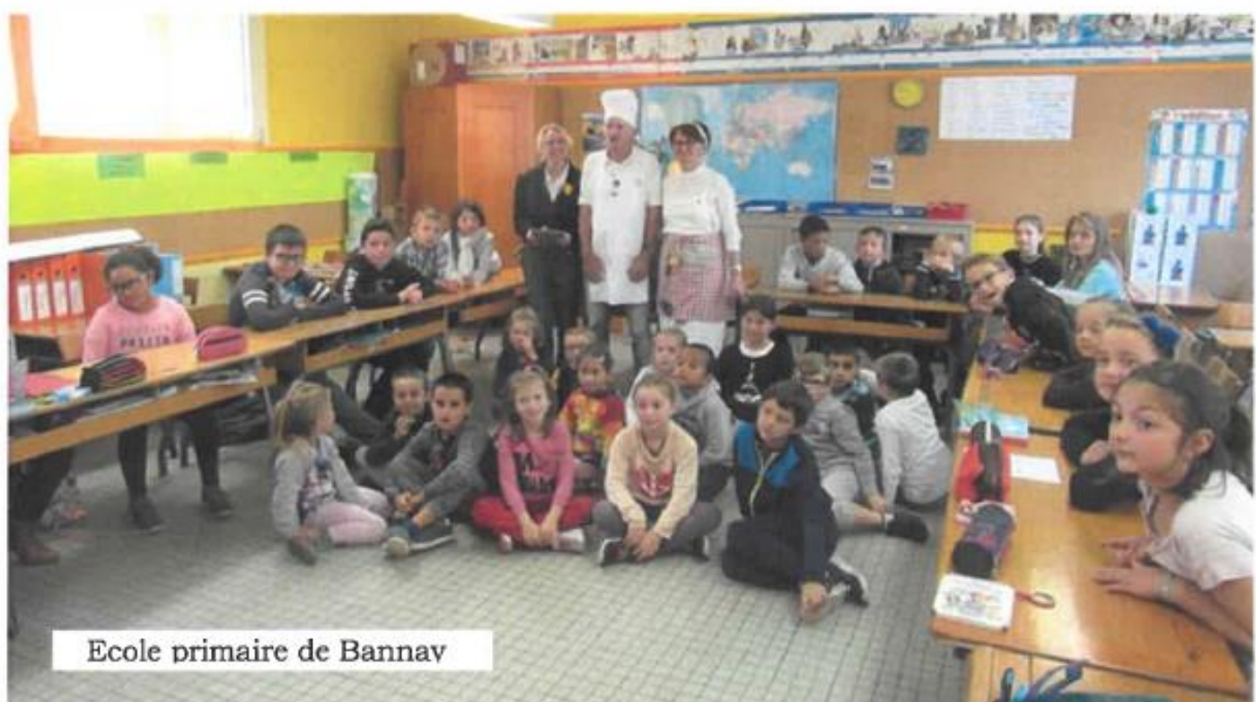
Ecole primaire de Bannay

Les BIBLIOTHÈQUES de Bannay, Belleville/Loire et Savigny en Sancerre font découvrir aux enfants la légende du « Joueur de flûte de Hamelin » au moyen d'un Kamishibai (théâtre de papier d'origine japonaise). La légende racontée à trois voix est enrichie par des bruitages et de la musique. La « tournée » des bibliothèques a débuté à Bannay et se poursuivra ensuite auprès des écoles de Belleville, Boulleret, Léré, Sainte-Gemme, Santranges, Savigny, Subligny et Sury en Vaux , pour le plus grand plaisir des yeux et des oreilles de nos petits écoliers !!!